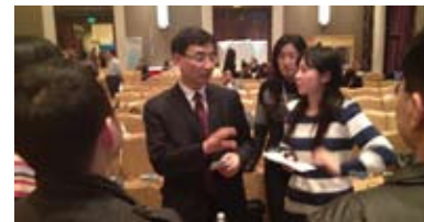
现场嘉宾的刨根问底