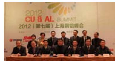
伙伴间的集体亮相