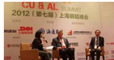
嘉宾间的头脑风暴