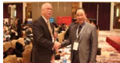
代表间的真诚问候