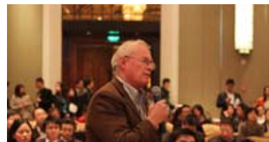
台上与台下的思维碰撞